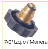
7/8" Izq. c / Maneral