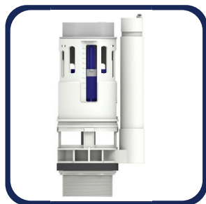
Válvula de descarga