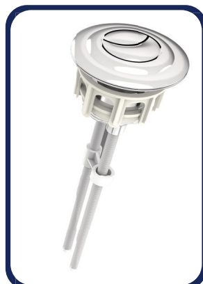
Un Botón independiente Doble acción para instalarse en la tapa superior del tanque