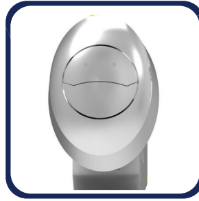
Botón de Doble acción