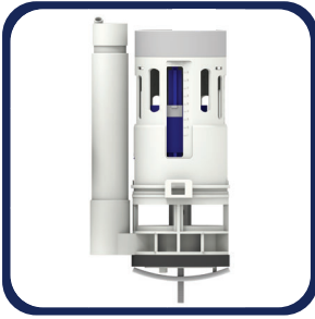
Válvula de descarga