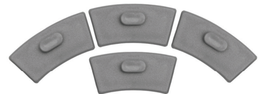
Tacones para ajuste de altura