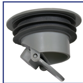
Válvula Antiolores (VAO*)