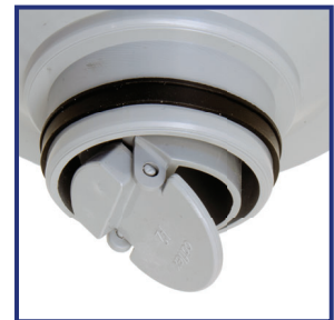
Empaque de Ajuste