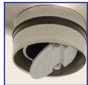
Empaque de Ajuste