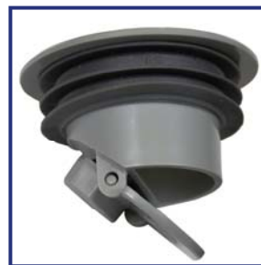
Válvula Antiolores (VAO)