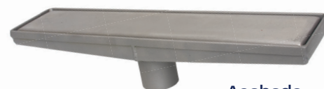
Acabado Acero Inoxidable