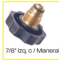
7/8" Izq. c / Maneral